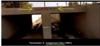
„Caution 9-11“ (Terminator 2 „Judgement Day“ 1991)