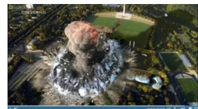
„Berliner Olympiastadion explodiert“ (Undercover Love 2, RTL 2010)