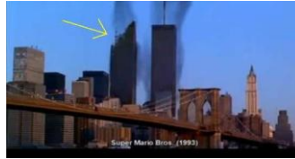
„Zerstörung des WTC“ (Super Mario Brothers 1993)