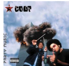
„Terror-Coup WTC“ Party Music Cover 7/2001)

Der Terroranschlag auf das New Yorker WTC am 11.09.2001 hat die Welt geschockt, obwohl bereits Jahre und Monate zuvor davor gewarnt wurde – u.a. in einer FEMA-Studie (US-Katastrophenschutz) und durch Insider-Hinweise in Spielfilmen und Pop-Songs. Trotz offenkundiger Indizien hielt niemand für möglich, dass sich die Prophezeiungen exakt am angekündigten Datum erfüllen sollten. Seit April 2011 liegt eine offizielle Bombendrohungen von Al-Qaida vor, für den 26.06.2011 soll sogar eine Anti-Terror-Übung des Berliner Kampfmittelräumdienstes geplant sein. Auch diesmal gibt es Insider-Hinweise auf einen Anschlag auf das Berliner Olympiastadion (mit einer „schmutzigen“ Mini-A-Bombe). Sind wir diesmal schlauer?