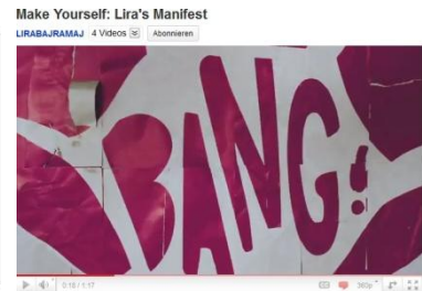
„Fußballbombe “Bang!” (NIKE's WM-Trailer Lira's Manifest 2011)