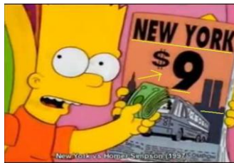
„New York 9 II“ (Simpsons 1997)