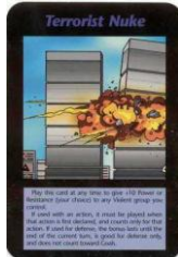
„Terrorangriff auf das WTC“ (Illuminati Card Game 1995)