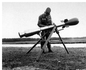
„Davy Crockett“: 1 kT-„Dirty Bomb“ der 7. US-Armee

Terroranschlag am 26.06. 2011 um 19:00 Uhr auf das Berliner Olympiastadion!