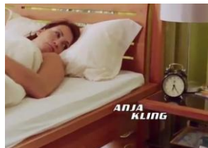
„Wecker auf 26 nach 6“ (Undercover Love 2, RTL 2010)