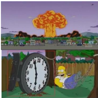
„Atomexplosion 6/11“ (Simpsons Episode 461, 2010)