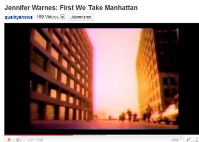
„Atomexplosionen Berlin“ (Jennifer Warnes / Leonard Cohen „First we take Manhattan“ 1987)