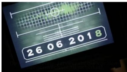
„ZEITRISS programmiert für den 26.06.2018“ (2+1+8=11) (Dr. Who, Staffel 5 2010)